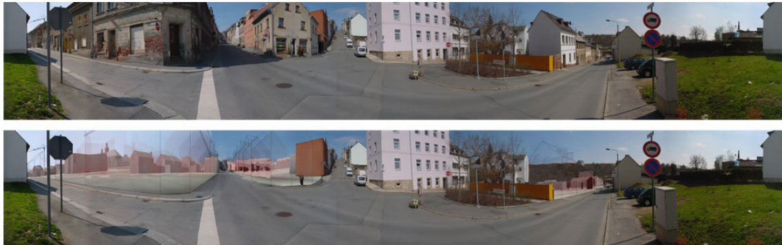
Abbildung 3: Virtuelle Simulation stadträumlicher Veränderungen im Bereich Stadteingang

Der 2. Teilbereich des Modells wurde 2005 erstellt und bildet das innerstädtische Sanierungsgebiet ab. Vor dem Hintergrund der demografischen Entwicklung wird in den nächsten Jahren eine Zunahme des Leerstandes bzw. behördlich angeordneter "Notabriss" aufgrund baufällig gewordener Substanz erwartet. Daraus resultierte die Zielstellung, eine Klassifizierung des Gebäudebestandes vorzunehmen und eine Prognose wahrscheinlicher Veränderungen im Gebäudebestand darzustellen.